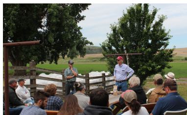
Palouse Colony Farm